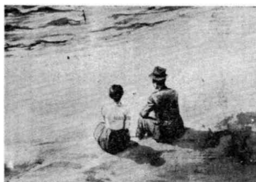
〈그림 4〉 이태준의 『화관』 123화 삽화 (『조선일보』, 1937. 12. 12.)