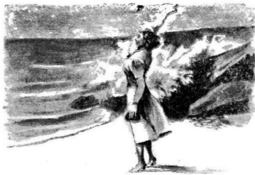
〈그림 3〉 김남천의 「바다로 간다」 35화 삽화 (『조선일보』, 1939. 6. 15.)