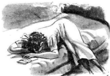
〈그림 2〉 김남천의 「바다로 간다」 34화 삽화 (『조선일보』, 1939. 6. 14.)