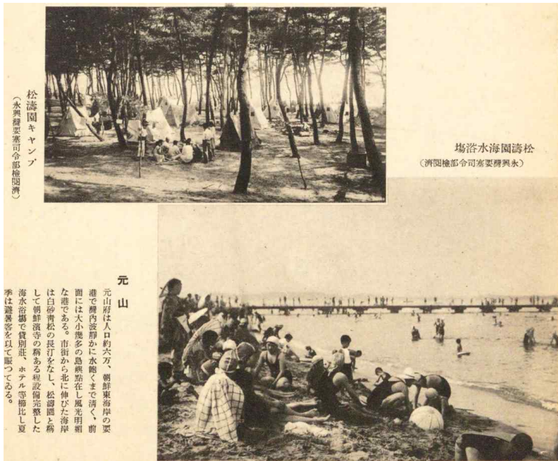
松濤園キャンプ (水興總要塞司令部松濤園)